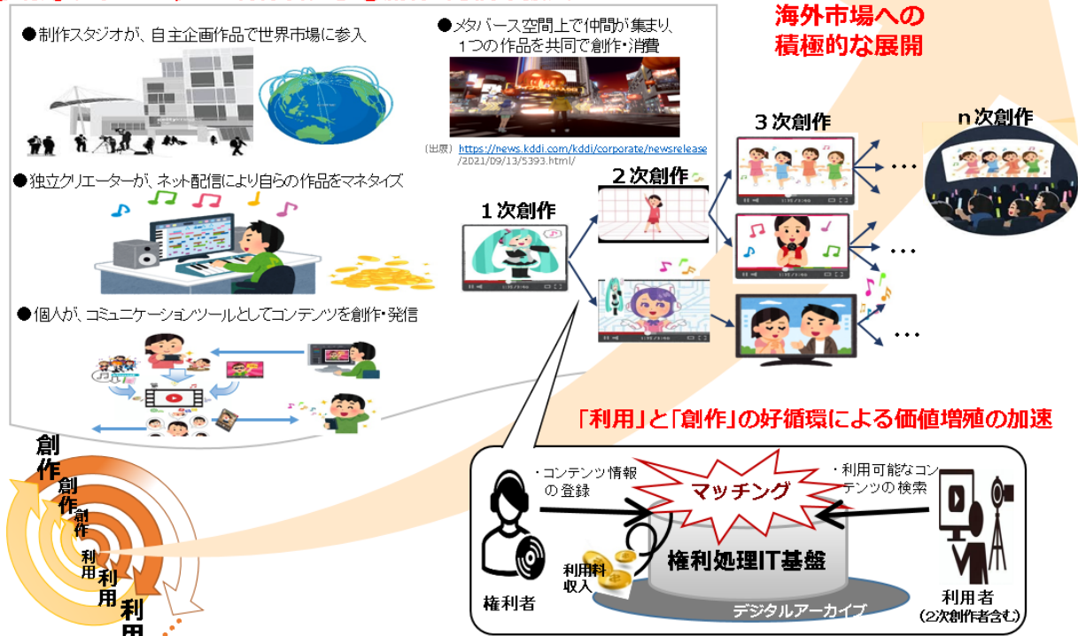
図 17 コンテンツ・クリエーション・エコシステムの活性化 (イメージ)